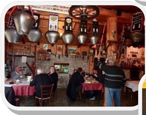
Au rêve de l'Armailli